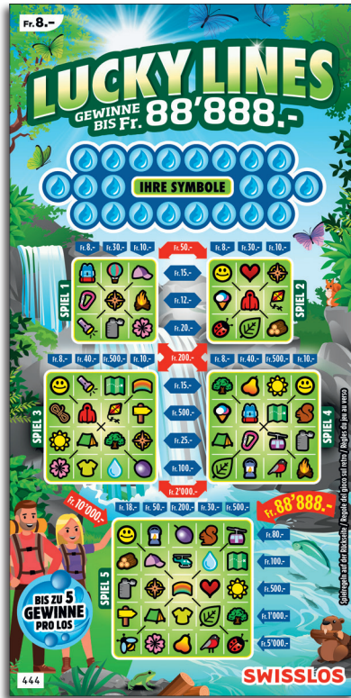
Esempio: La vincita è di Fr. 28.- = (Fr. 8.- + Fr. 20.-)