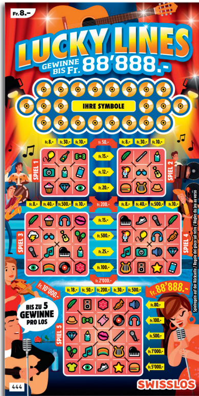
Beispiel: Gewinn Fr. 28.- = (Fr. 8.- + Fr. 20.-)